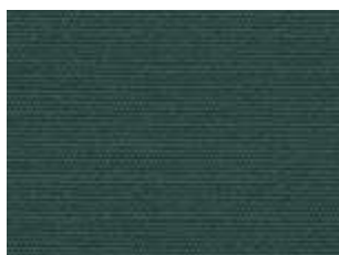
Plus Botella 2862