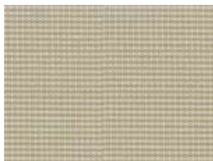
Plus Safari 2853