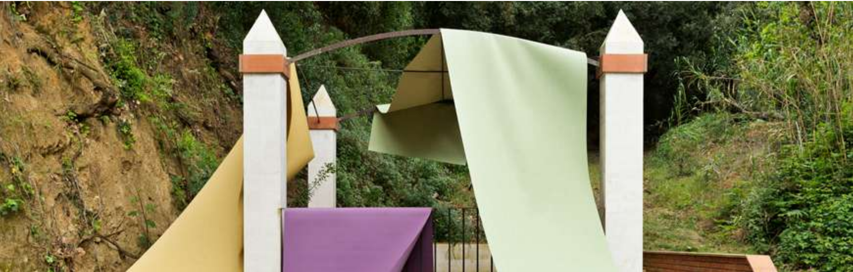
Country House, Barcelona (2019)

Plus is the perfect choice for projects that require a reinforced 100% solution dyed acrylic fabric. Plus es la opción perfecta para los proyectos que requieren un tejido reforzado 100% acrílico tintado en masa.