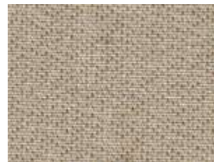
Plus Siroco 8344