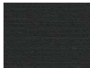
Plus Negro 2855