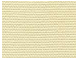
Plus Vainilla 2845