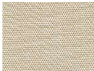
Plus Tennere 8326