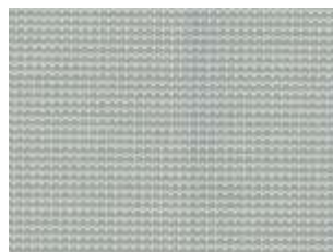
Plus Plata 2854