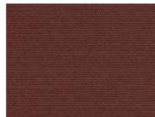
Plus Granate 8313