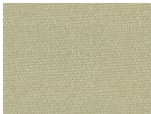
Plus Seda 8325