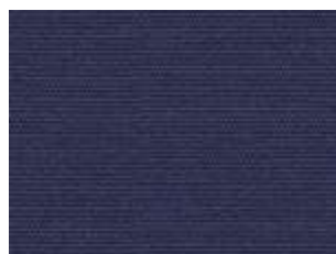
Plus Marino 2863