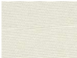
Plus Blanco 2861